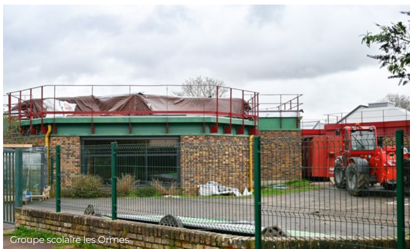
Groupe scolaire les Ormes

Sur le plan éducatif, nous devons entretenir, moderniser et sécuriser nos écoles afin de garantir aux enfants les meilleures conditions d'apprentissage. Nous devons aussi accompagner notre jeunesse, soutenir les familles, renforcer les solidarités dans un contexte social qui reste marqué par de fortes fragilités.