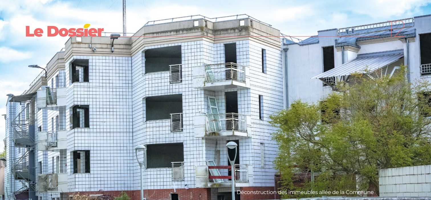
Déconstruction des immeubles allée de la Commune

Rédaction : Face à ces contraintes, quelle est votre ligne politique ?