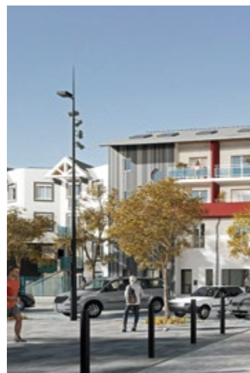
Résidence place François-Mitterrand avenue