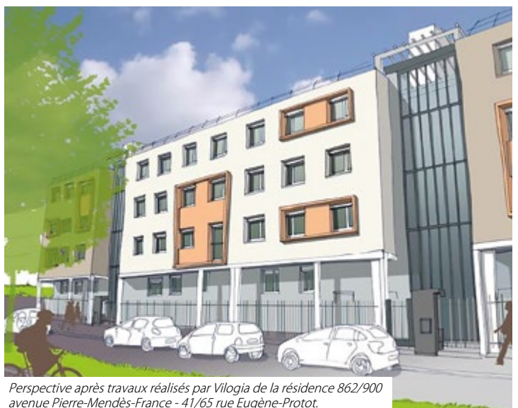
Perspective après travaux réalisés par Vilogia de la résidence 862/900 avenue Pierre-Mendès-France - 41/65 rue Eugène-Protot.