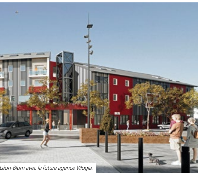
Léon-Blum avec la future agence Vilogia.