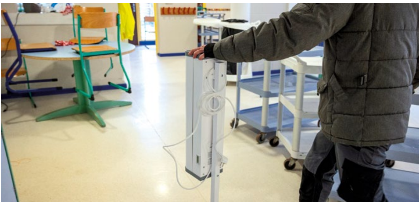
Installation de purificateurs d'air dans les écoles