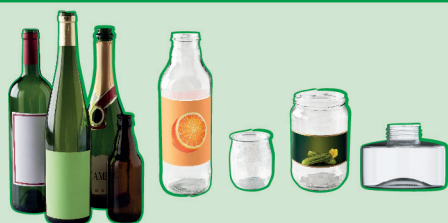
Bouteilles, pots, bocaux, flacons... en verre

Mettre le verre en VRAC sans sac, sans bouchon ni couvercle, à l'intérieur des bornes d'apport volontaire dédiées