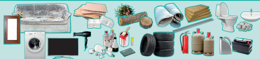
Objets volumineux, déchets végétaux, cartons, appareils électriques et électroniques, déchets dangereux, déchets de travaux, sanitaires, bouteilles de gaz, extincteurs, huiles de vidanges, batteries...

Trouver une déchèterie ? dechets.grandparissud.fr