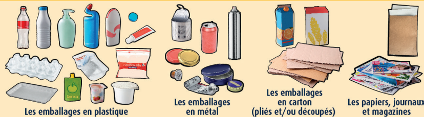
Les emballages en plastique

Déposer les emballages vides et papiers, en VRAC, dans la poubelle ou la borne, sans les mettre à l'intérieur d'un sac