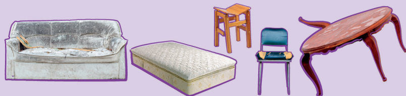
Objets dits volumineux inférieurs à 2 m de long et 30 kg - Le mobilier doit être démonté.