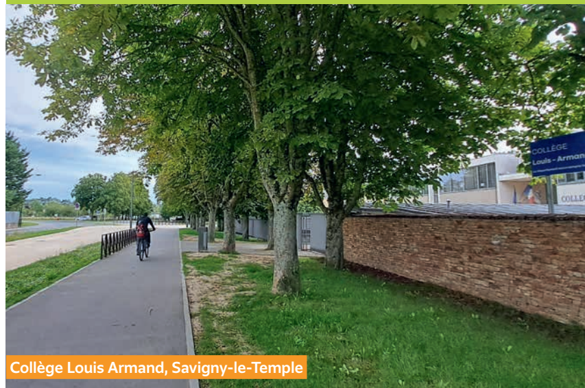
Collège Louis Armand, Savigny-le-Temple

Plaquette d'information à destination des élèves et parents d'élèves